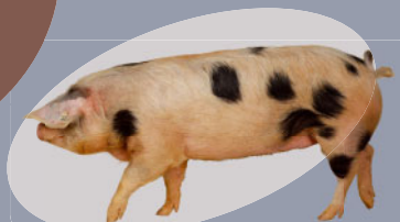
Porc de Bayeux