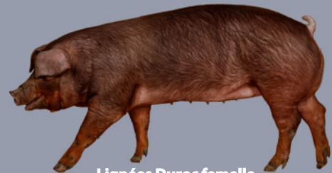
Lignées Duroc femelle Duroc dam lines