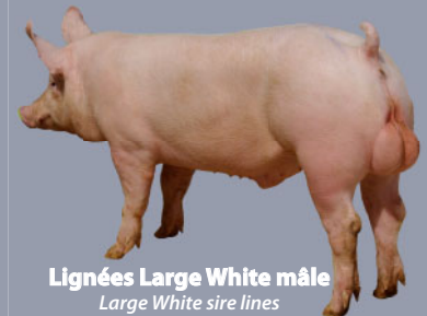
Lignées Large White mâle Large White sire lines