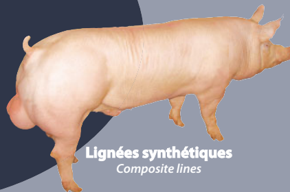
Lignées synthétiques Composite lines