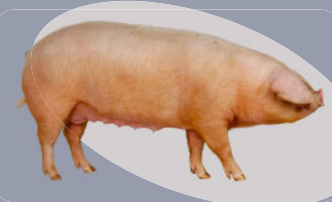
Porc Blanc de l'Ouest