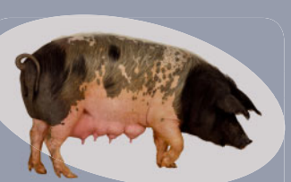
Cul Noir Limousin