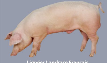
Lignées Landrace Français Landrace French lines