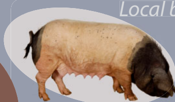
Pie Noir du Pays Basque