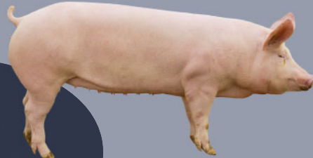
Lignées Large White femelle Large White dam lines