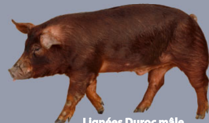
Lignées Duroc mâle Duroc sire lines