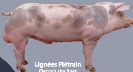
Lignées Piétrain Pietrain sire lines