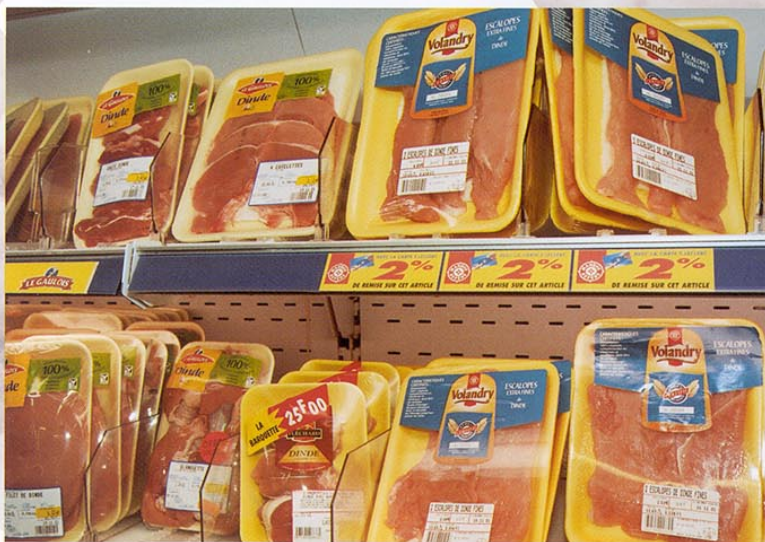
Frans kalkoenvlees in het koelschap. Bekende merken zijn onder andere Le Gaulois, Père Dodu, Maître Coq en Gastronomie.

Kalkoenfilet is mals, wit spiervlees zonder been of vel. Het vlees kan in plakjes worden gesneden, maar net zo gemakkelijk als een rollade worden verkocht. Smakelijke varianten zijn voorts producten als medaillons, braadplapjes ('la minute'), ragouts en vanzelfsprekend de vleeswaren op basis van kalkoenvlees.