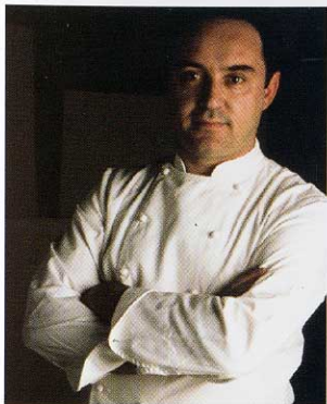
ferran adrià RESTAURANTE EL BULLI cala montjoi ROSES (GIRONA)

Definir a Ferran Adrià es tan complejo como colorear los sentidos o ponerle límites al placer. Sí nos atrevemos a añadir dos palabras: talento y revolución; ambas han hecho de Adrià uno de los mejores cocineros del mundo, capaz de presentar cada año más de una treintena de nuevos platos en su santuario gastronómico de Cala Montjoi.